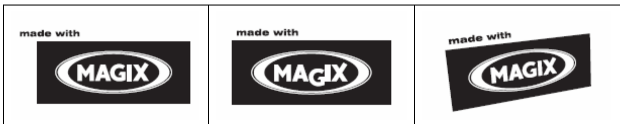
不可改變圖形內容間相對位置