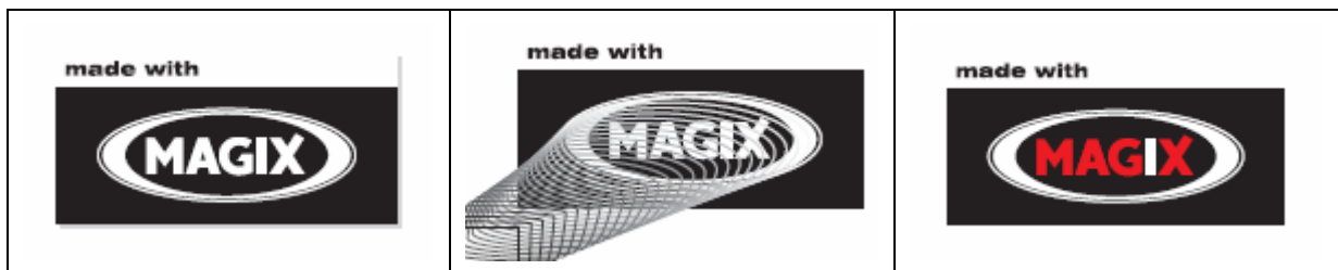
圖形不可加上陰影或反射效果