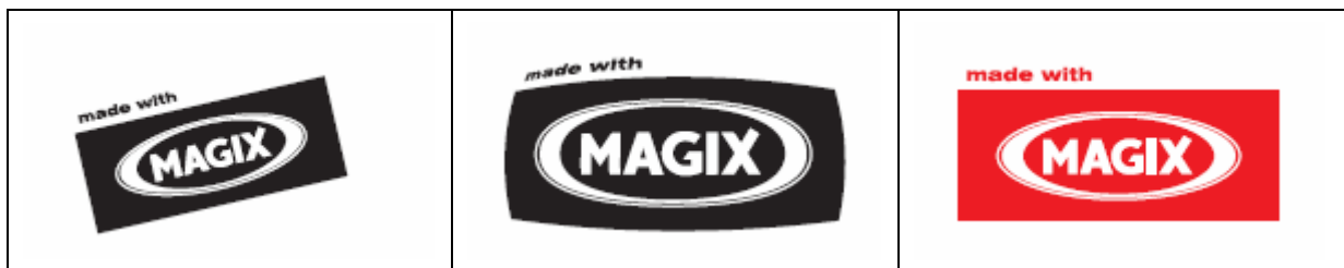
不可旋轉商標圖形